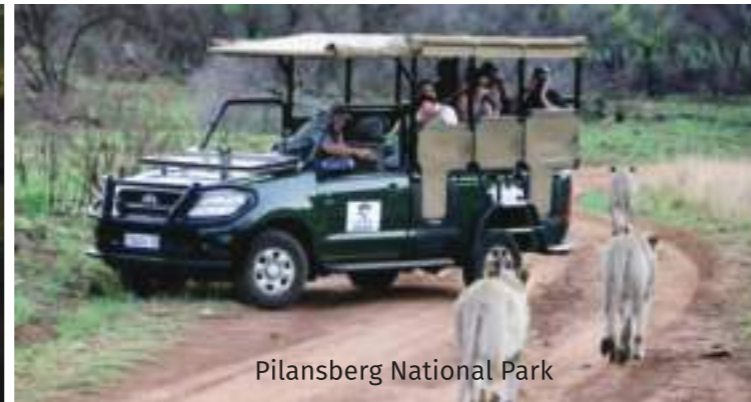
Pilansberg National Park