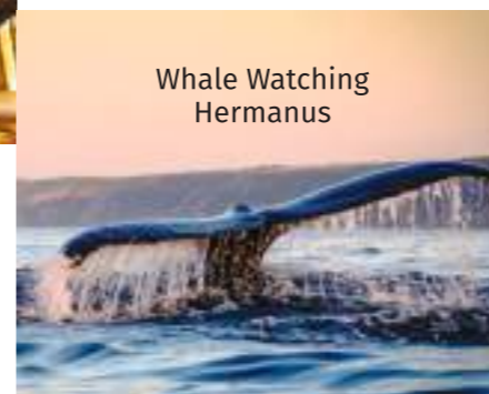
Whale Watching Hermanus

Après le petit-déjeuner nous conduirons en direction de la réserve naturelle de « Cape Point » pour atteindre la Pointe du Cap de Bonne Espérance, la pointe la plus au Sud du continent Africain en passant par Camps Bay, Hout Bay, Chapman's Peak et la colonie de pingouins de Boulders. Au Cap de Bonne Espérance vous pourrez prendre le téléphérique pour le sommet et redescendre à pied et nous pourrions prendre le déjeuner au restaurant panoramique du coin. La cuisine y est délicieuse pour un prix avantageux. De retour au Cap, vous pourrez prévoir votre dîner selon vos envies, nous vous donnerons quelques idées.