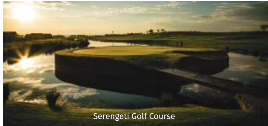
Serengeti Golf Course

Petit-déjeuner au lodge et nous roulerons pendant 2 heures pour atteindre notre prochaine étape qui est la réserve du Pilansberg où nous logerons dans un autre lodge africain traditionnel 5*, un endroit inoubliable qui restera pour vous une référence en Afrique, Ivory Tree. Après le déjeuner nous prendrons notre minibus et ferons la découverte des « big 5 » dans le parc, avant d'aller faire un safari au coucher du soleil avec les rangers du parc et dîner au lodge. Pension complète et safari inclus.