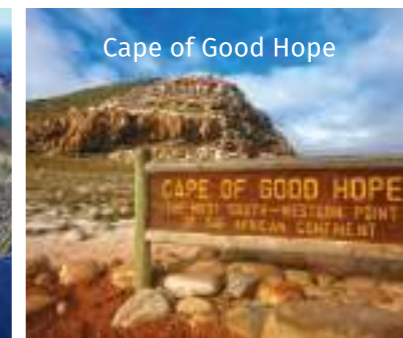
Cape of Good Hope