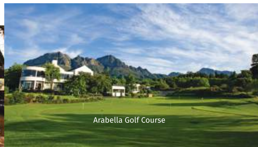
Arabella Golf Course

Enfin, nous conduirons vers le cœur des vignes de Stellenbosch, au vignoble de Lanzerac où vous jouerez d'une expérience viticole exceptionnelle et d'un logement de grande élégance.