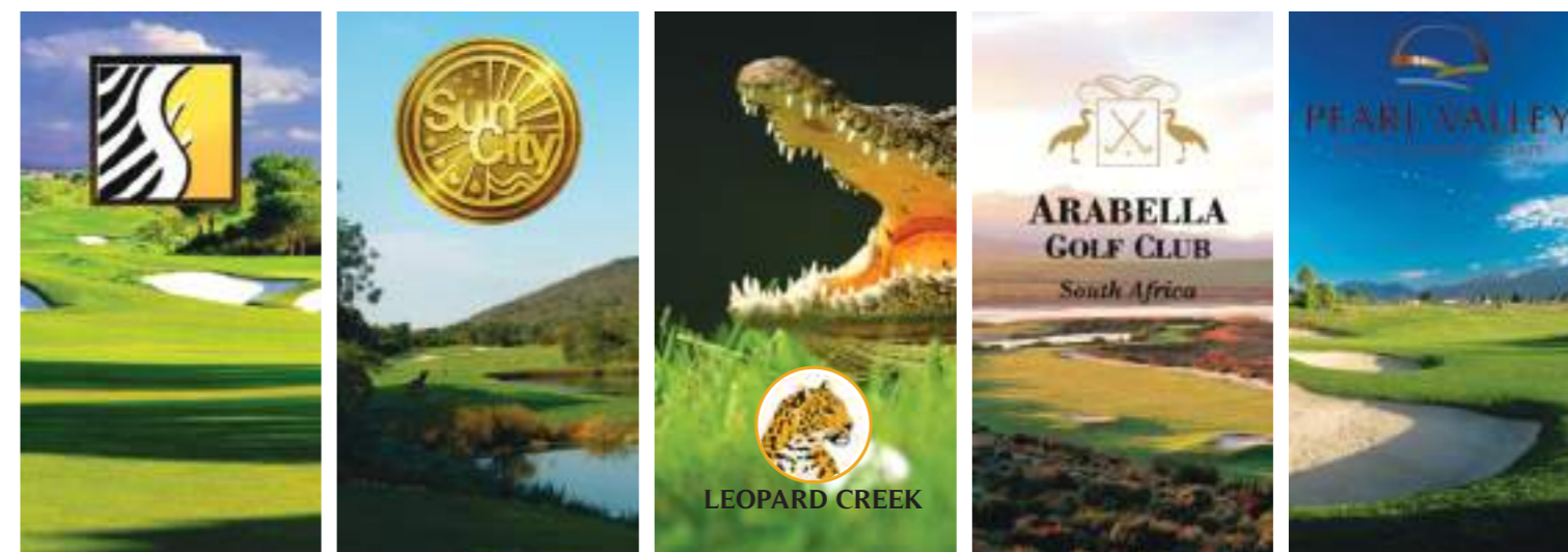
SERENGETI Conçu Par Jack Nicklaus

Jouez sur les 5 parcours de Golf les mieux classés du pays