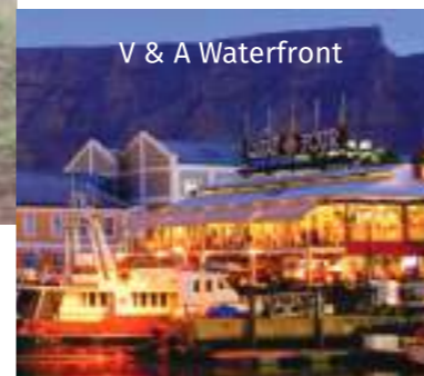
V & A Waterfront

Départ matinal vers 05.00 pour un safari au lever du soleil et retour au lodge pour prendre votre dernier petit-déjeuner dans la savane. Transfert pour l'aéroport de Nelspruit et vol interne pour le Cap (2 heures). Transfert en minibus pour le centre du Cap, et logement sur le Victoria & Albert Waterfront, votre résidence sur le port pour 2 nuits. Vous pourrez aller découvrir le centre ville par vous-mêmes à pied. Dîner libre.