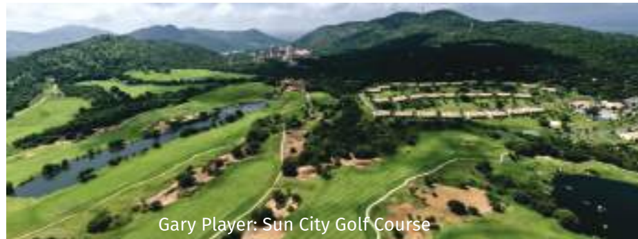
Gary Player: Sun City Golf Course

Petit-déjeuner matinal au lodge et départ pour Sun City (30 mn de route) pour jouer sur le célèbre golf dessiné par Gary Player. Après votre parcours, vous pourrez décider de profiter de visiter Sun City, cet ancien volcan transformé en Casino et attractions, ou de rentrer profiter du spa et de coucher de soleil au lodge. Dîner au lodge inclus.